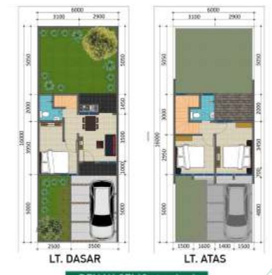
DENAH CELIO standard LB 60 / LT 96