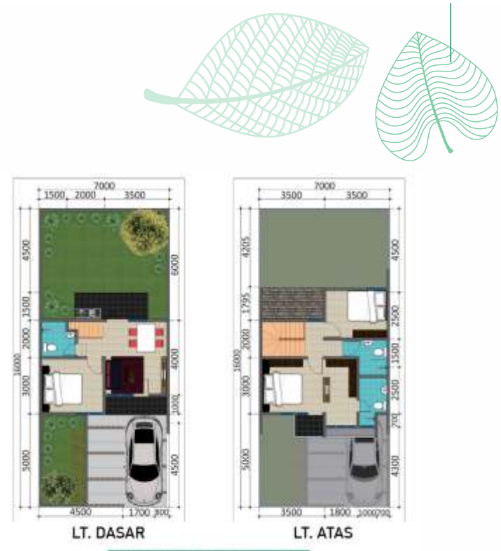
DENAH AVENTINO standard LB 79 / LT 112